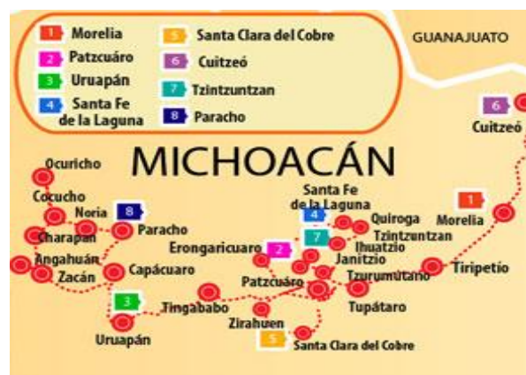
Mapa 2.- Ruta Don Vasco

A continuación, en el Mapa 2, se presenta la Ruta Don Vasco del Estado de Michoacán, donde se busca elevar la calidad de 20 municipios. (México, 2010).