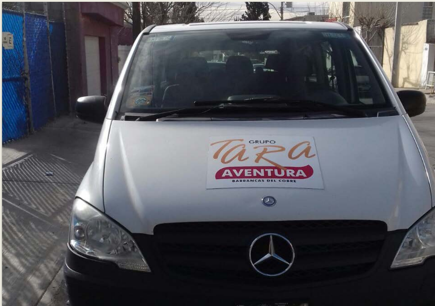
MERCEDES BENZ, 7 PASAJEROS