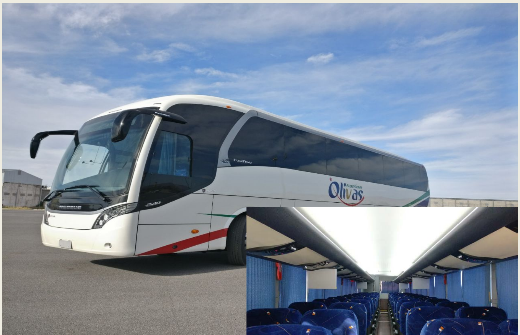
AUTOBUSES 2016, 45 PASAJEROS