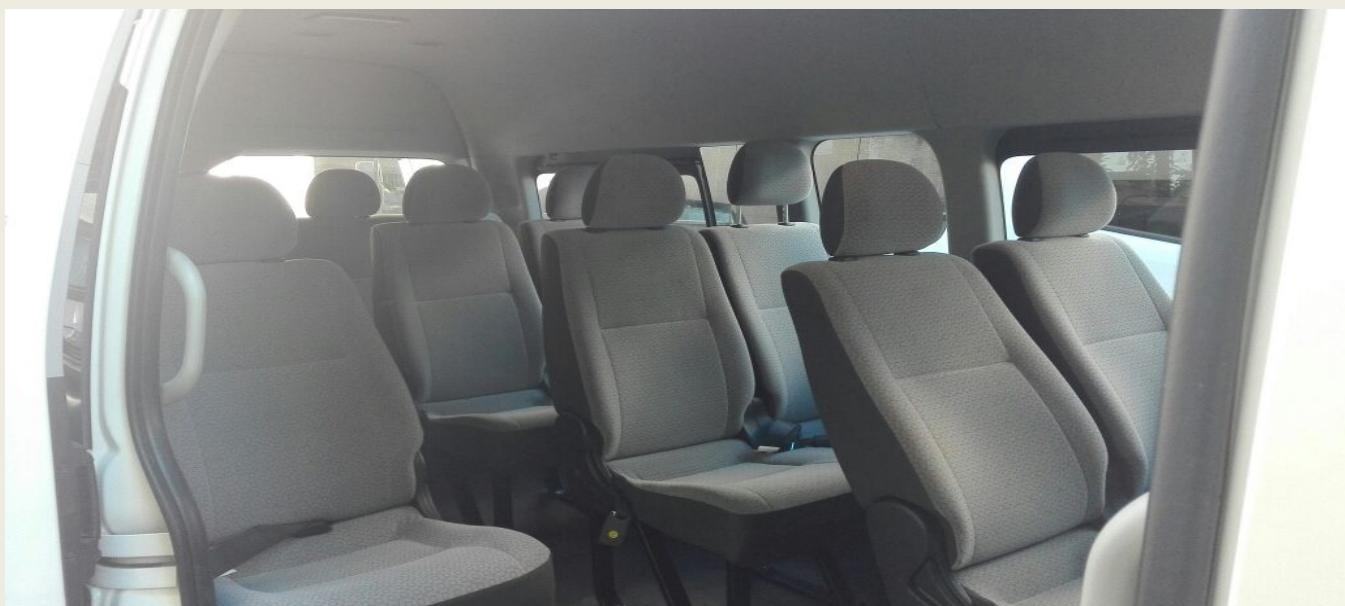
TOYOTAS 2015, CAPACIDAD 15 PASAJEROS