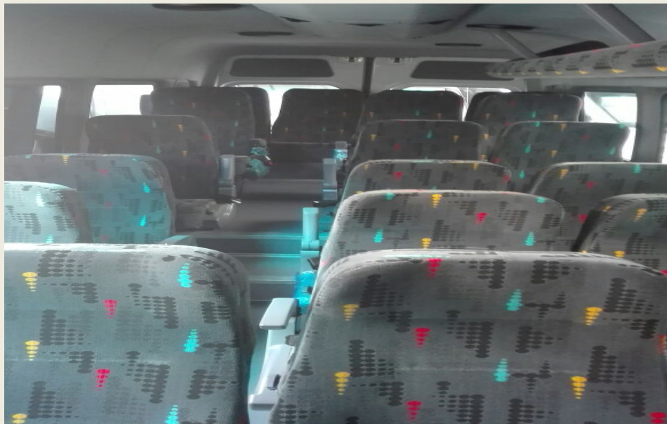
SPRINTER 2017, CAPACIDAD 18 PASAJEROS CON EQUIPAJE