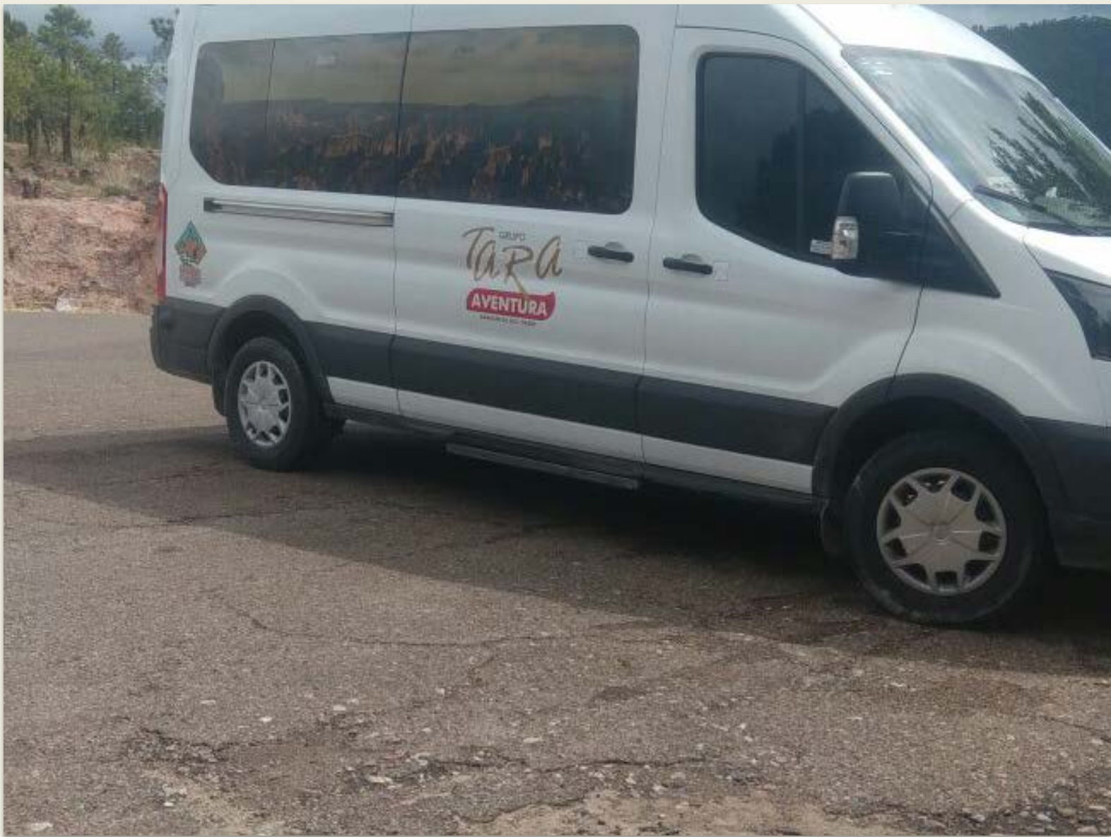
VAN TRANSIT MODELO 2018, 15 PASAJEROS