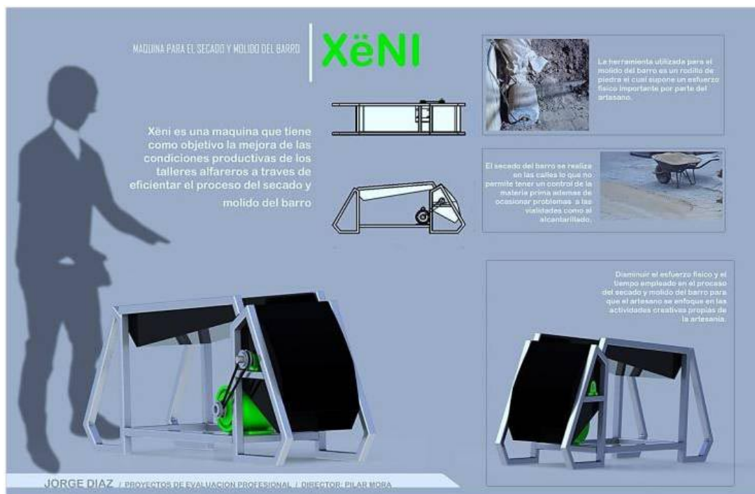
Imagen 1. Proyecto de Diseño Industrial. Molino de barro

Fuente; Proyecto de tesis elaborado por el becario de diseño industrial. Jorge Díaz Cervantes, estudiante de la licenciatura en diseño industrial