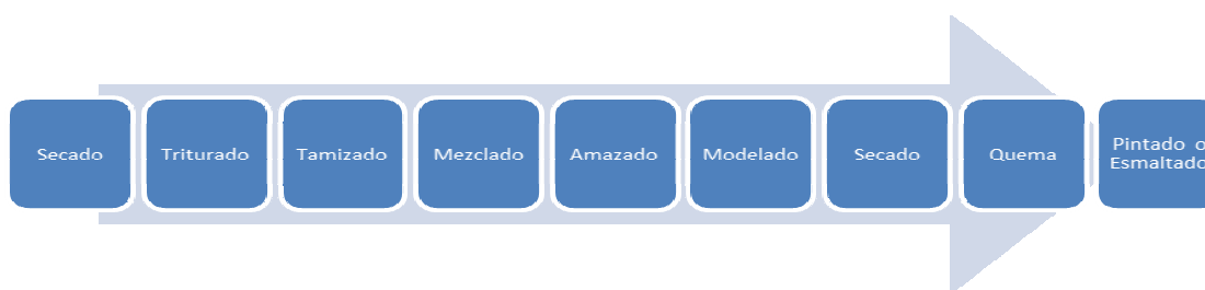
Gráfica.1 Proceso de Producción

Como tercera etapa del método, se elabora una exploración de la historia de vida, de los actores entrevistados: