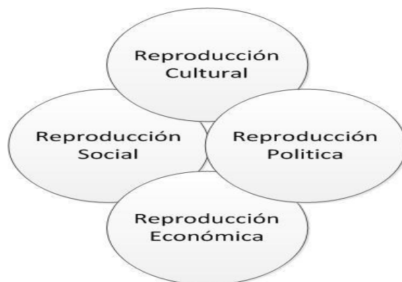
Figura 1. Modos de reproducción social de los pueblos