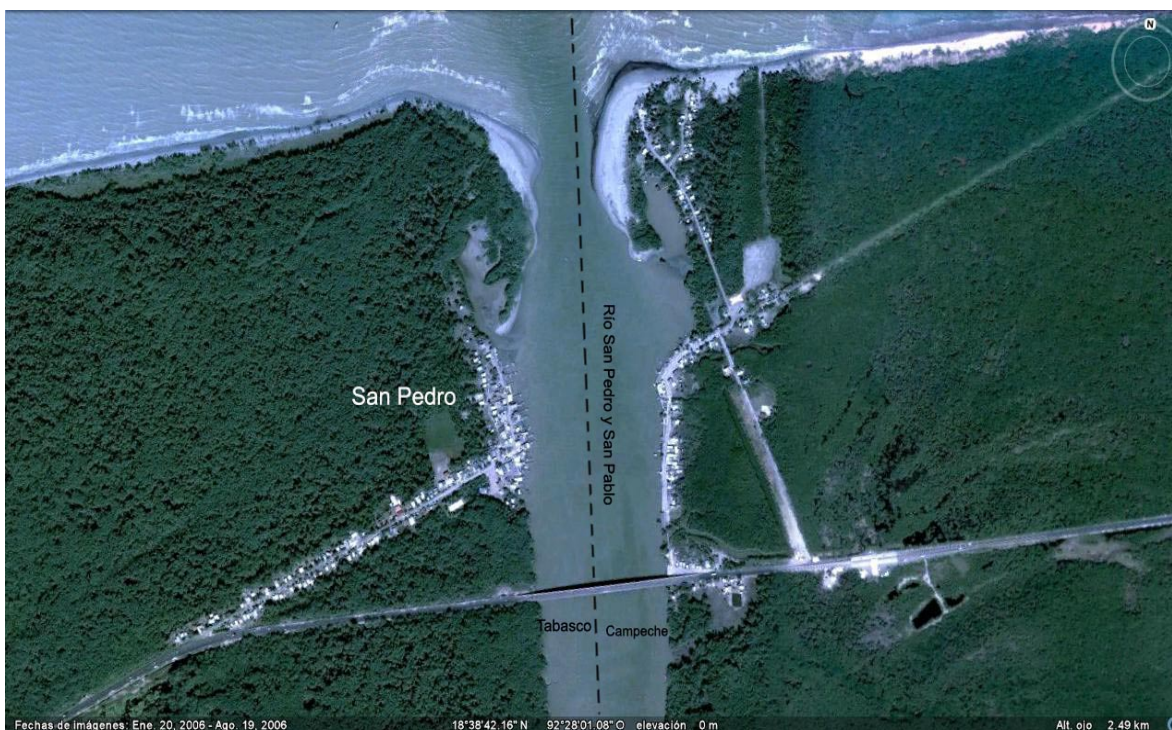
Figura 1. Localización del Puerto Barra de San Pedro, Centla, Tabasco.

Al este de la ciudad de Frontera (cabecera del municipio de Centla) se encuentra el río San Pedro y San Pablo en la boca del cual se encuentra la Barra San Pedro (BSP) entre los paralelos 18°40' de latitud norte y 93°39' de longitud oeste (Figura 1).